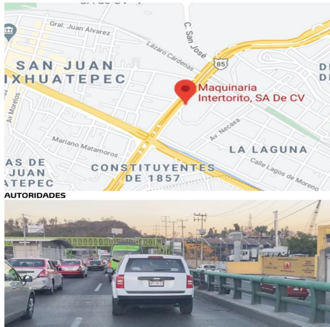
Km. 2.8, Carr. Federal Pachuca - México 10, La Laguna, 54190 Tlanepantla de Baz, Méx. Intertorito empresa que renta maquinaria

A la solicitud anexó un archivo en Word de tres páginas cuyo contenido se muestra a continuación: